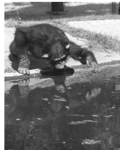
Chimpancé joven jugando con su reflejo (De Waal y otros, 2005: 11141).

Recuerdo todavía la casa de mi abuela en Colima, cuando de muy pequeño, a principios de los años sesenta, veía coexistir dos tecnologías para iluminar la casa: una, muy lejana de mi experiencia en la Ciudad de México, con quinés de petróleo que